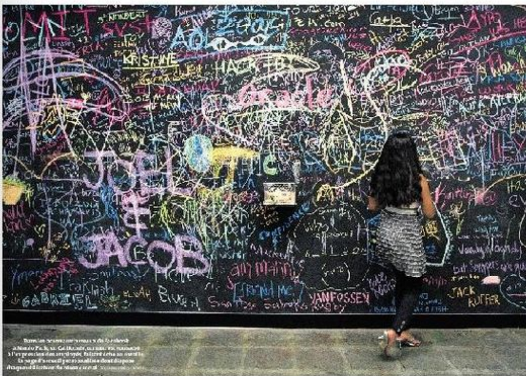
Tout un réseau sur le mur de la start-up à l'Université de Toulouse. Ici, ce lieu est devenu un espace à l'initiative des étudiants, faisant vivre au quotidien la page d'un réseau social où les idées se partagent à grande vitesse.

RETROUVEZ CHAQUE SEMAINE LES OFFRES D'EMPLOI PAGES 12 à 15